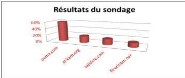
Figure 1: Résultats du Sondage Effectué Chez les Jeunes Musulmans en France

maîtriser la langue arabe pour avoir un accès direct aux sites authentiques du Monde musulman. 12% déclarent vérifier les informations puisées du Net avec leurs imams lors des prières collectives dans la mosquée.