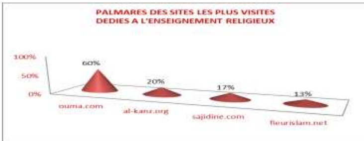
Figure 2: Palmarès des Sites les Plus Visités Dédiés à l'enseignement Religieux

on retrouve les mêmes louanges. Ainsi pour le grand quotidien espagnol El País: Le site Oumma.com est le bien site le site de référence de l'islam francophone". Parcourir la presse européenne, le site en question collectionne les éloges; ce site, prône un islam tolérant, diffuse reportages, conseils et interviews (l'Express.fr), que Oumma.com est le site phare des musulmans francophones (...) plébiscité par les musulmans (le magazine VSD).